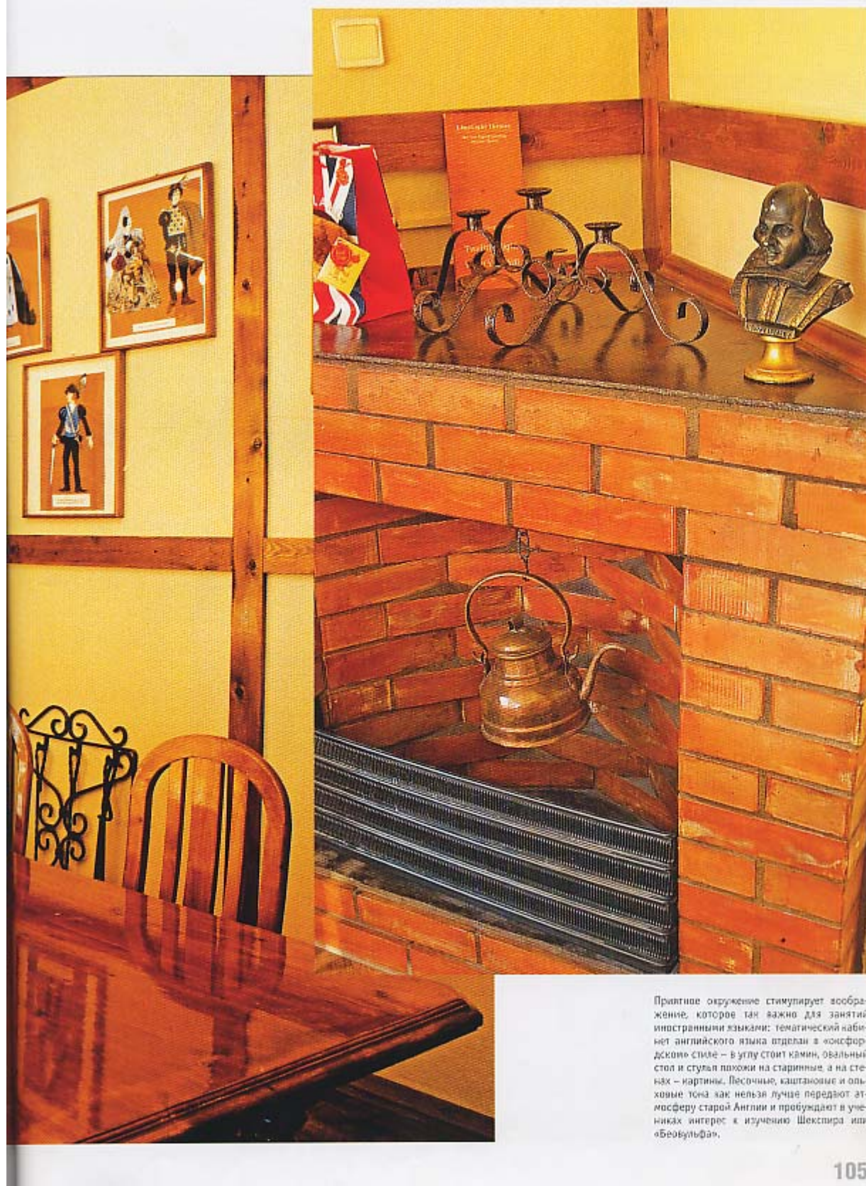
Приятное окружение стимулирует восприятие, которое так важно для занятий иностранными языками: тематический кабинет английского языка отделан в «консфордском» стиле – в углу стоит камин, овальный стол и стулья похожи на старинные, а на стенах – картины. Песочные, каштановые и ольховые тона как нельзя лучше передают атмосферу старой Англии и пробуждают в учениках интерес к изучению Шекспира или «Беовульфа».